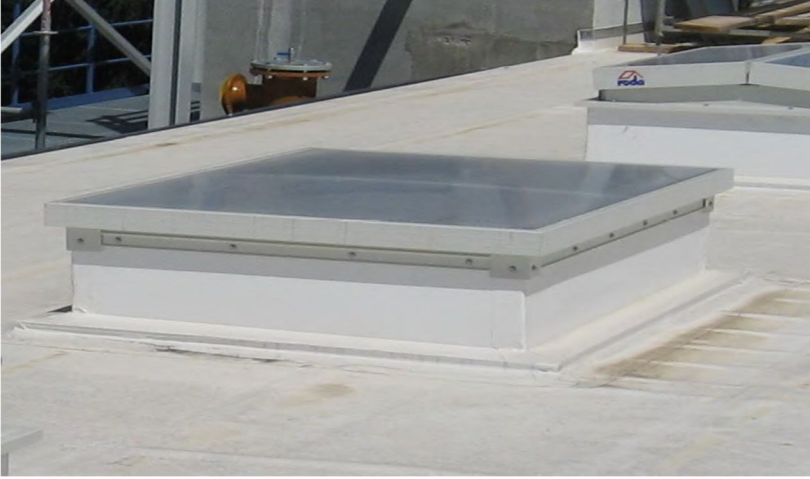
Table 1 פתיחה חשמלית לאוורור טבעי